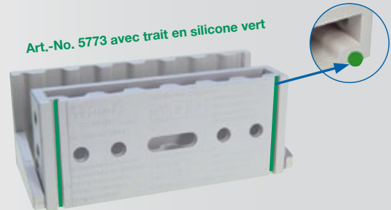
Art.-No. 5773 avec trait en silicone vert